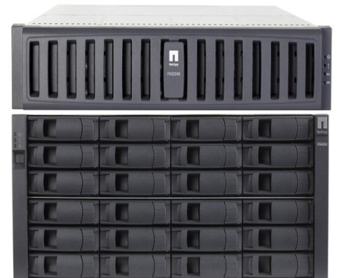
FAS2040 előlap, DS4243 diszkpolccal

Az ingyenes távdiagnosztika (AutoSupport) képességről és rugalmasan bővíthető támogatási szolgáltatásokról külön tájékoztatónkban olvashat!